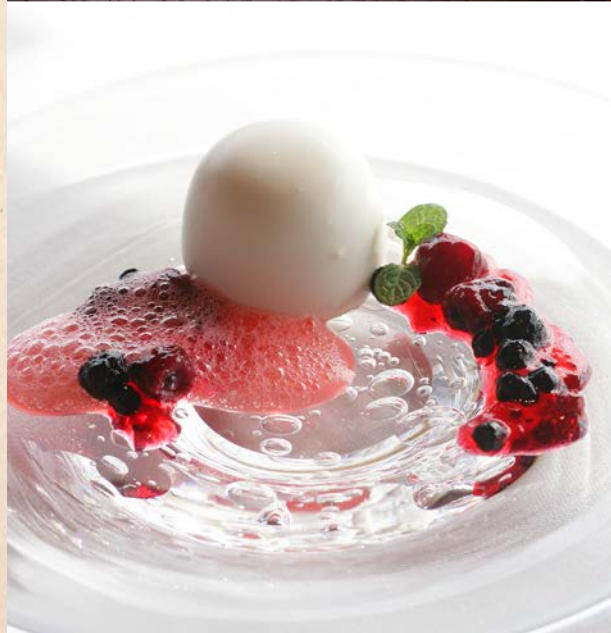
商品写真はイメージです。実際の提供商品とは異なります。